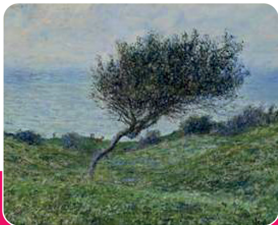
Marina a Trouville C. Monet